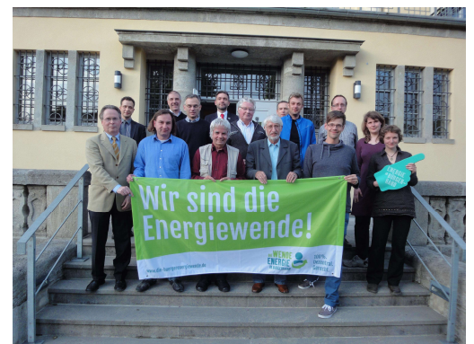
Gründung des BürgerEnergie Thüringen e.V. Erfurt, 3. Juni 2015 Geschäftsstelle: c/o KDGT, Erfurt, Alfred-Hess-Straße 37