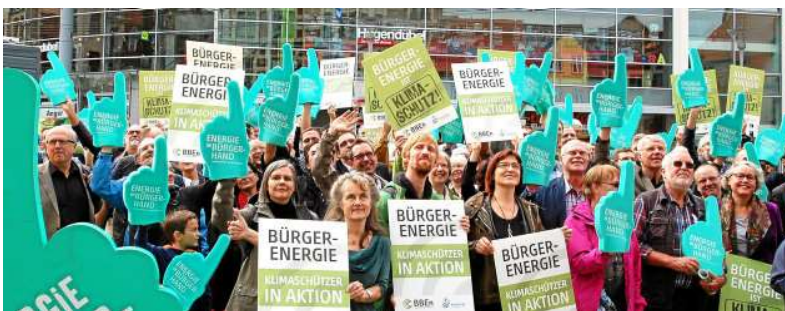
Erfurt: 2. BürgerEnergie Forum, 25.-26.9.2016 und 1. Thüringer BürgerEnergie-Tag 26.9.2015