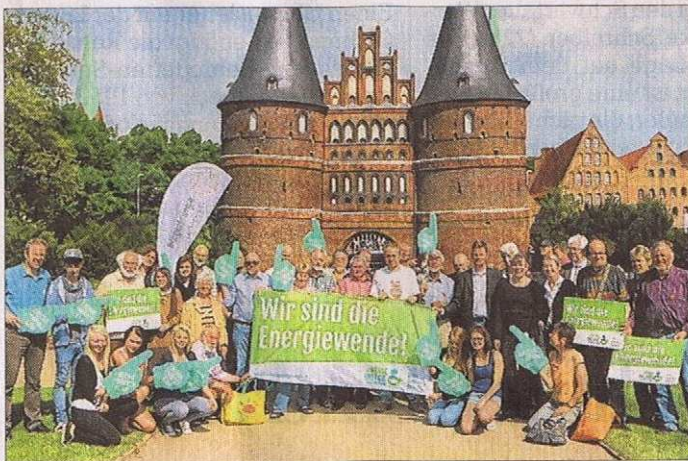
Mit Transparenten werben Mitglieder vor dem Holstentor für die Energiegenossenschaft.